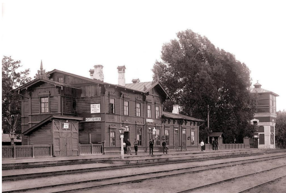
Станция Колтубанка, 1912 год.