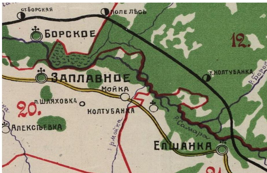
Колтубанка в составе Елшанской волости, карта 1912 года.

14 июля 1920 года в результате Сапожковского восстания станция Колтубанка была захвачена восставшими и разобран железнодорожный мост через реку Боровку.