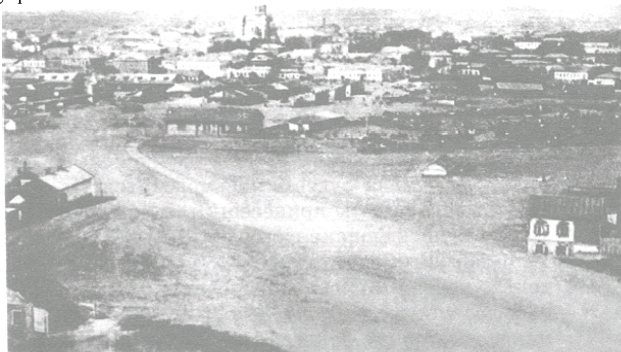
Вид на город с колокольни монастыря. Справа виден Сенной базар (1900 г.).