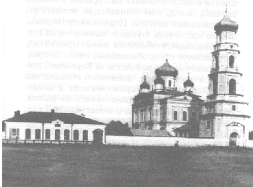
Колокольня Успенского женского монастыря.

мастерские, восковой свечной завод, обеспечивающие монастырю значительные доходы. Церковно-приходская школа как очень шумная выносится за стены монастыря, разбивается монастырский сад, устраивается пруд, обсаженный ивой. Загородное монастырское хозяйство за Каргалкой становится образцовым, полностью обеспечивая питанием не только проживающих в монастыре - излишки реализовывались на рынке. Образцовым становится и монастырский хор, своим плавным звучанием привлекая большое количество богомольцев.