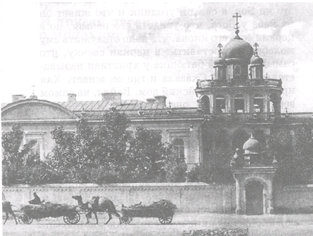
Архиерейский дом в Оренбурге.

А то и был сам преосвященный епископ Макарий. Он внимательно выслушал Хаю и направил ее в женский монастырь к престарелой настоятельнице игумений Таисии, прозорливой подвижнице. В монастыре ей очень понравилось. Она заявила, что после крещения хочет стать монахиней. Когда святое таинство над ней свершили, то нарекли ее Таисией. Тогда ей было всего 16 лет.