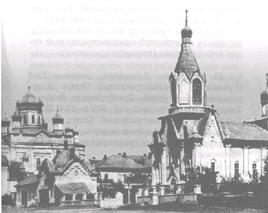
Общий вид Успенского женского монастыря.

Выселенные монахини устраивались на жительство в частных домах, преимущественно в Форштадте, зарабатывая себе на жизнь шитьем стеганых одеял, обработкой козьего